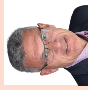
Pirmin Schwander, Nationalrat, Lachen SZ

«Das Covid-Zertifikat widerspricht dem Rechtsstaat und der offenen Gesellschaft: Ohne jede Evidenz werden Menschen dem Generalverdacht unterstellt, andere zu schädigen. Von diesem Verdacht müssen sie sich durch ein Zertifikat unter willkürlichen Bedingungen reinwaschen.»