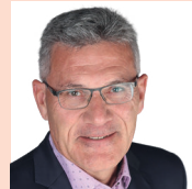
Pirmin Schwander, Nationalrat, Lachen SZ

«Das Covid-Zertifikat widerspricht dem Rechtsstaat und der offenen Gesellschaft: Ohne jede Evidenz werden Menschen dem Generalverdacht unterstellt, andere zu schädigen. Von diesem Verdacht müssen sie sich durch ein Zertifikat unter willkürlichen Bedingungen reinwaschen.»